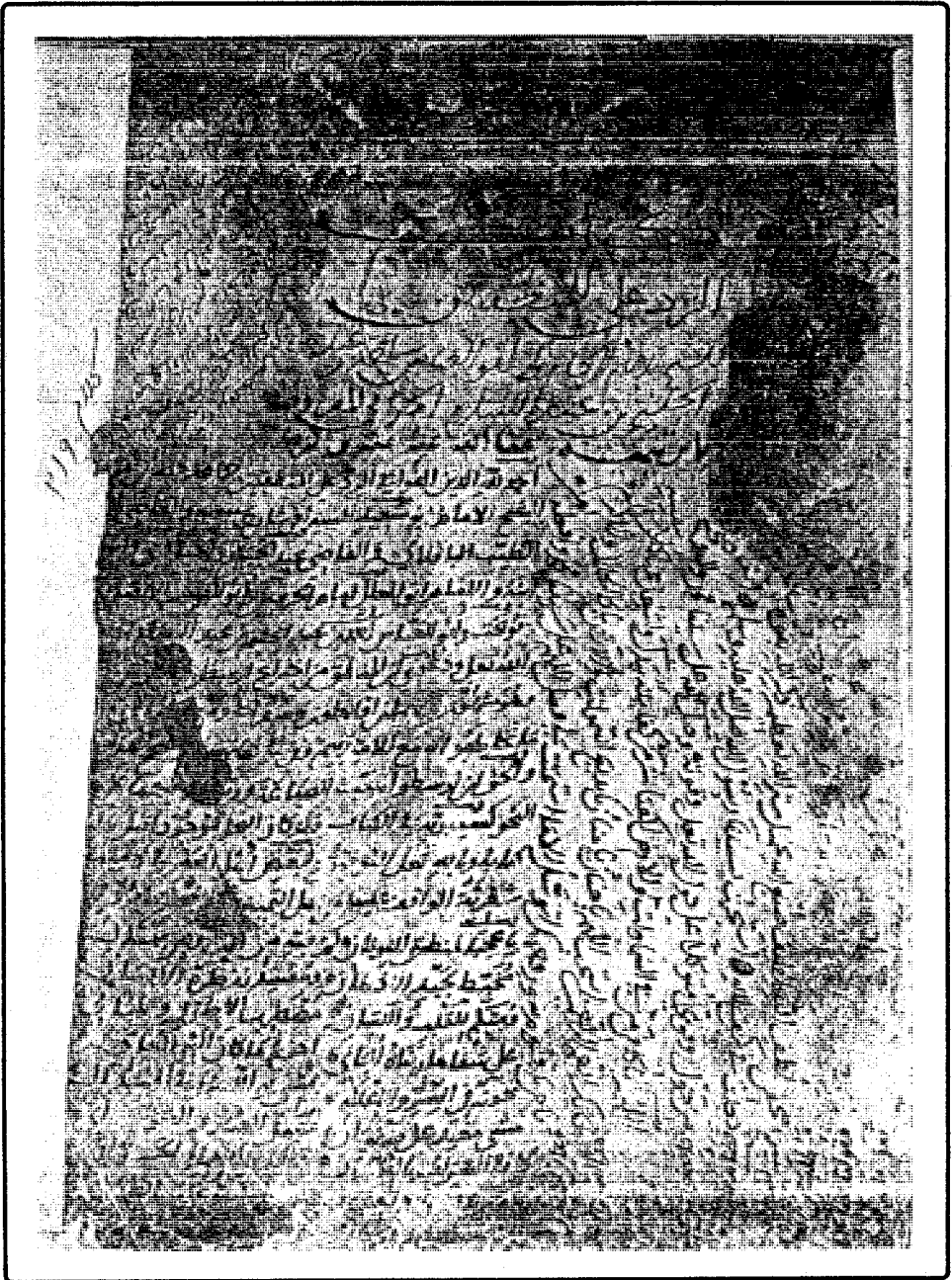
صورة غلاف النسخة الخطية من كتاب «الرد على المنطقيين» المحفوظة بخزانة الكتب الأصفية بحيدر آباد الدكن تحت رقم ٢١٩ من علم الكلام. وخفاء الصورة لانساخ الغلاف.